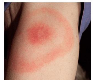
2 Inny przykład rumienia

W zasadzie wiedzieliśmy jedno – to na pewno Borelioza. Wiedząc, że antybiotykoterapia jest wyniszczająca dla organizmu (szczególnie 8 latki), postanowiliśmy zastosować metody alternatywne.