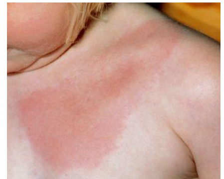
1 Rumień wędrujący

W dniu 22.06.2016 na terenie Cygańskiego Lasu w Bielsku-Białej moją córkę Martę ugryzł kleszcz. Początkowo nie miała żadnych objawów, natomiast w okresie wakacyjnym pojawiały się jej podobne do ugryzień komarów bąble (najpierw pojedynczo, w późniejszym okresie wychodziło ich więcej – niestety, wyglądało jak ugryzienia komarów - bez tych odczynów jak na zdjęciu nr 2). W sierpniu 2016 jak Marta wróciła z wakacji pojawiły się jej placki jak po ugryzieniach muchy końskiej/ślepcy. Niestety nie dysponuję fotografią jej rumienia, natomiast zdjęcie nr 1 obrazuje jak to wyglądało – z tym że miała na brzuchu i udach (ugryzienie kleszcza nastąpiło pod kolanem).