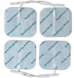
3 Elektrody TENS

Zabiegi biorezonansem Rife'a, który używa elektrod TENS naklejanych krzyżowo na ręce i nogi (prawa ręka – lewa noga, lewa ręka – prawa noga). Zabiegi trwały po dwie godziny dziennie – po zabiegach obserwowalny efekt Herxheimera (ból głowy, złe samopoczucie) oraz odczyny na skórze jak poniżej na zdjęciach: